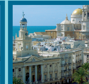
Plaza de San Juan de Dios