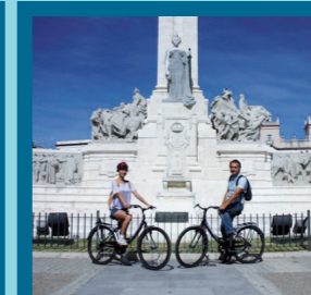
Plaza de España