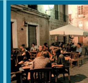
Barrio de El Pópulo