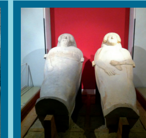
Museo de Cádiz