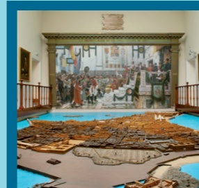
Museo de Las Cortes