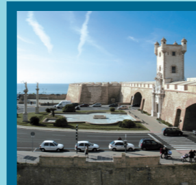
Puertas de Tierra