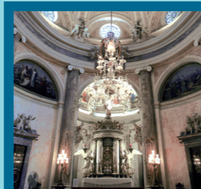
Oratorio de la Santa Cueva